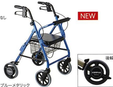
ブルーメタリック