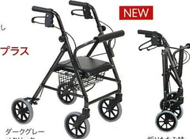
ダークグレーメタリック