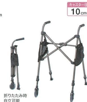
折りたたみ時 自立可能