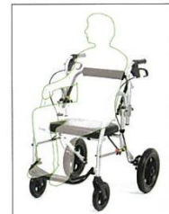
簡易車いすとして