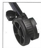
ティッピング機能付き