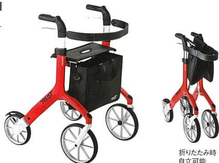
折りたたみ時 自立可能

デザイン性に優れたスポーティーなフレームで 後輪には路面からの振動を弱めるダンパー付きで 快適な歩行をサポートします