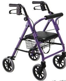
パープルメタリック