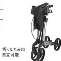
折りたたみ時 自立可能